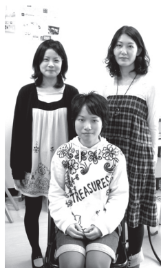
▶優秀賞を受賞し取材を受けてくれた3人