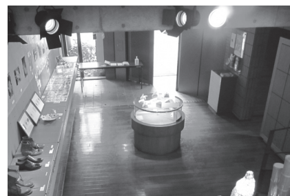
▲踊り場から見た1Fフロア