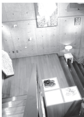
◀二階から見た階段の展示

見に来たお客さんからも 様々な意見をいただいたよう で、来年の見通しも立ててい ました。